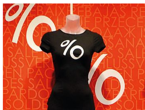
I saldi? Ufficialmente partono il 6 luglio